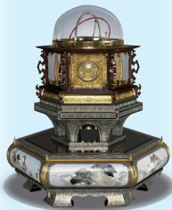
田中久重「万年時計」(複製品)